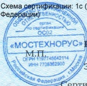
Схема сертификации: 1с (ГОСТ Р 53603-2020 Оценка соответствия. Схемы сертификации продукции в Российской Федерации)